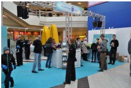
Tietoturvaviikon yleisötapahtuma Koskikeskuksessa 13.2.2010

Tilaisuus oli kaikille avoin, ja paikalle sai tulla kysymään mediakasvatukseen ja tietoturvaan liittyviä kysymyksiä asiantuntijoilta, tutustumaan verkkomateriaaleihimme jne. Tapahtumassa oli myös kilpailu, jonka palkintona arvottiin oikein vastanneiden kesken Xbox. Pisteellä päivystivät hankkeessa mukana olevien organisaatioiden asiantuntijoita.