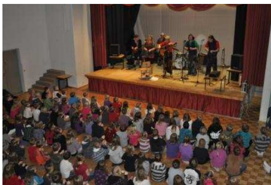
Paukkumaissin konsertti kokosi yhteen koko Hakalan koulun.